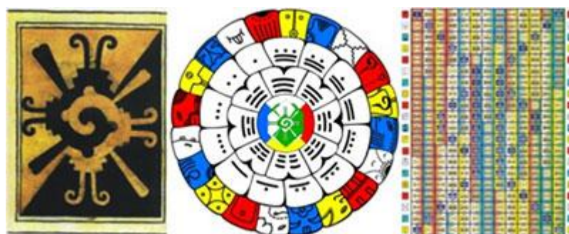
Die Zeitqualität im globalen 13-Monde-Zyklus (26.07.2018 – 25.07.2019):